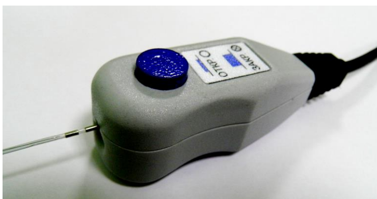
Рис. 4.3. Блок контактирования и электрод диаметром 1,2мм. Слева - проксимальная часть цилиндрического электрода Справа - блок контактирования.

4.2.2. Подключение электродов к стимулятору осуществляется с помощью универсального коннектора, USB разъем которого вставляется в соответствующее гнездо на задней стенке стимулятора. Коннектор позволяет подключать электроды имеющие диаметр проксимальной части от 1,2 мм до 2,0 мм, с 2-мя или 4-мя контактами. Коннектор имеет блок контактирования со стороны подключения электродов. На рис.4.3 показан блок контактирования и проксимальная часть цилиндрических электродов диаметром 1,2мм. Для соединения электрода с блоком контактирования, необходимо нажать пальцем на кнопку и вставить электрод в отверстие на торцевой стенке блока контактирования до упора, после чего отпустить кнопку.