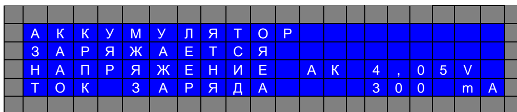
Рис. 4.5. Экран дисплея в режиме «Зарядка»

4.4.5 В конце заряда напряжение аккумулятора должно быть (4,1- 4,2) В и ток заряда должен уменьшиться до величины (0 - 50) мА. Признаком конца заряда является мигание светодиода «Аккумулятор» попеременно красным и зеленым цветом. Зарядное устройство можно отключать в любое время. При этом стимулятор автоматически выключится.